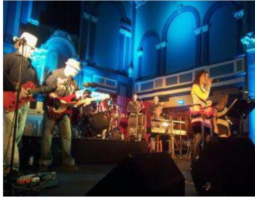
Barapolo en spectacle à l'ancienne Église Christ-Roi

Quoi de mieux pour nourrir l'Esprit d'équipe que de commencer l'année avec une soirée dansante dans une salle unique en son genre avec un groupe de musiciens qui soutiennent notre cause ? C'est dans cet optique que plusieurs Rotariens et Rotariennes du Club de St-Hyacinthe se sont retrouvés à la première soirée dansante organisée par La Scène et mettant en vedette le groupe Barapolo. Ce fut une excellente opportunité de renforcer les liens d'amitié entre nous et même d'en créer de nouveaux. Nous nous sommes rappelés que les membres du Club représentent un groupe fort et uni auquel il est bon d'appartenir.